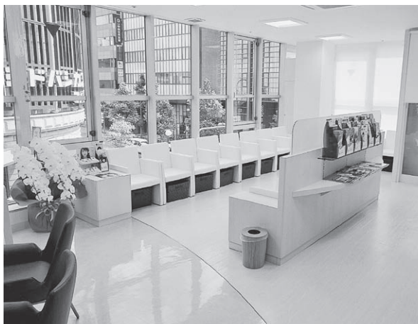
京都駅前診療所コンタクトレンズ供給部門 広く、明るく、3階に拡充オープン

もないコンタクトレンズ (二十行)二枚以内、ホー を独創した日本人の物語 ムページ応募可、表彰.. で、五つの中野眼科診療 特賞一本図書券三万円、 所で先着三百名に無料配 一等二本図書券二万円な 布されています。 感想文応募資格は、京 都府在住の中・高校生に 限ります。応募期間：八 月三十一日まで、書き 方：原稿用紙(二十字× 四一・五五八七番。 〇八